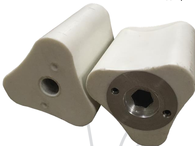
Комплект роторов (кулачков)