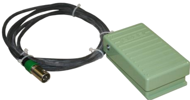
Педадь управления для ДШ-37