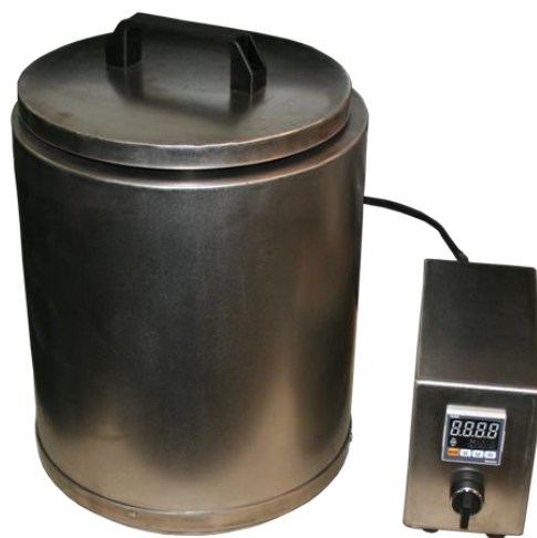
Бак с подогревом на 15 литров