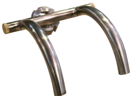
Насадка для орешков D15