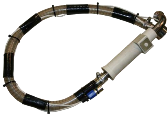
Дозирующий пистолет с армированным шлангом