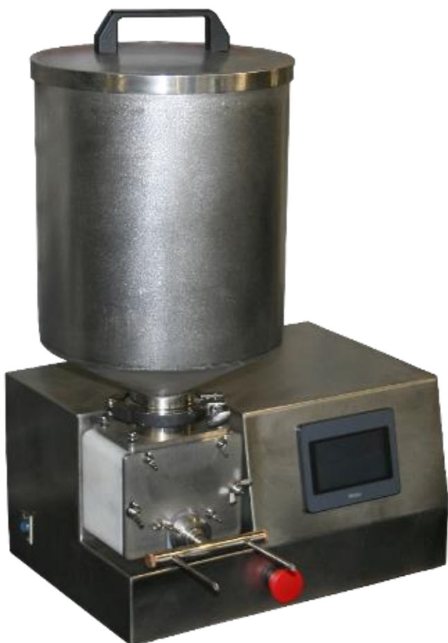
Шестеренчатый шприц-дозатор ДШ-37