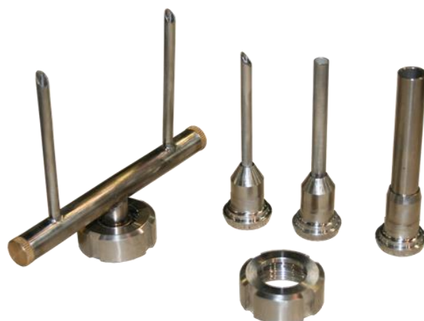
Комплект насадок базовой комплектации